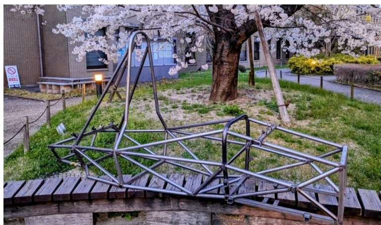
図9.今年度のフレーム