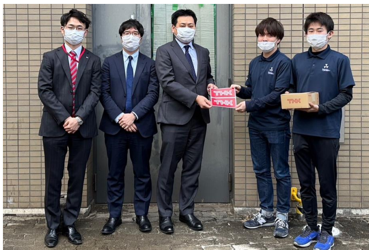
図 6. THK 株式会社の方々との写真

お忙しい中、私達のためにお時間を割いてくださった THK 株式会社様に厚い御礼申し上げます。