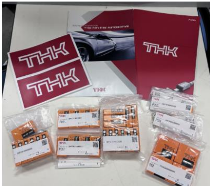
図 5. 支援していただいたロッドエンド

また、THK 株式会社様が弊チームの部室にお越しになりました。企業案内や製品についてなど、貴重なお話を伺うことができました。