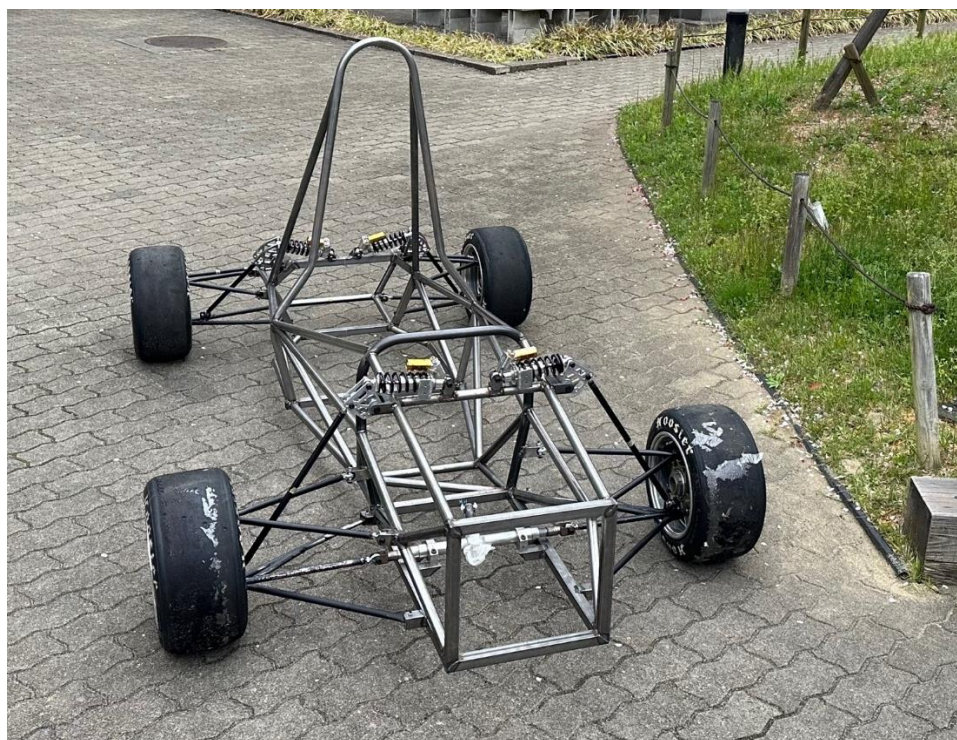
図 1. 23project 車両

そして、多大なるご支援していただいております企業の皆様、先生方、OBの皆様方に深く感謝いたします。今後とも宜しくお願い申し上げます。