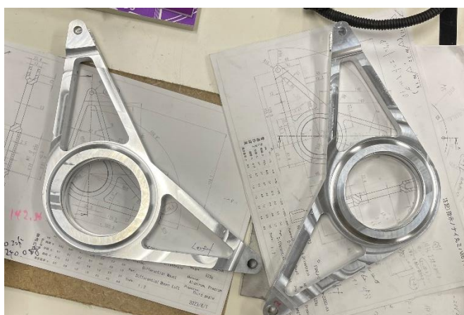
図 10. 今年度のデフマウント

デフマウントをNC旋盤にて、製作いたしました。4月は、デフマウントブラケット等の製作やシフター関連の取り付けを行います。