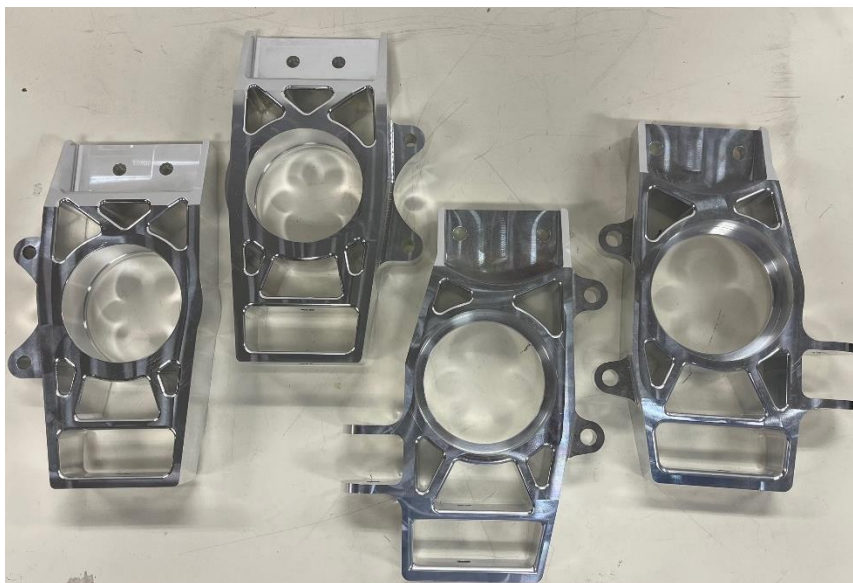
図7. 製作していただいたアップライト