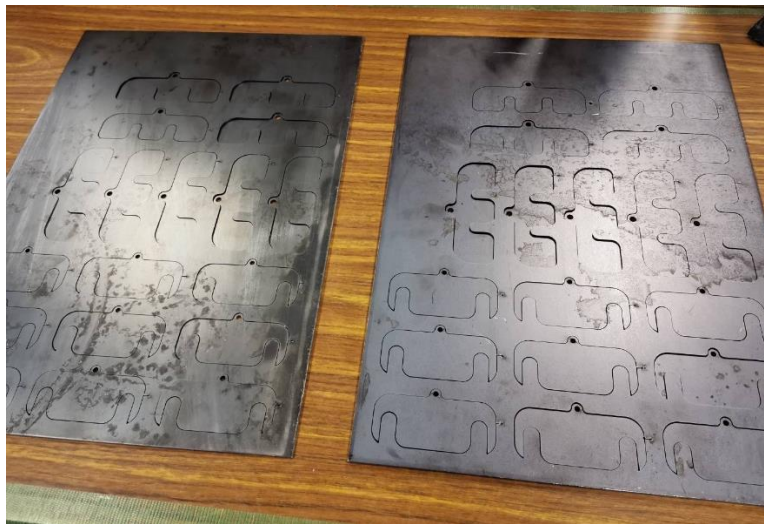
図2. 製作していただいたアライメント調整用シム