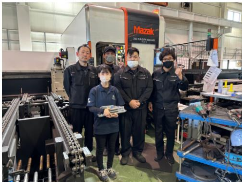
図 3. 上野鉄工株式会社の方々との写真

レーザーカット加工をしていただくパイプを上野鉄工株式会社様に持ち込んだ際には、工場の見学もさせていただきました。