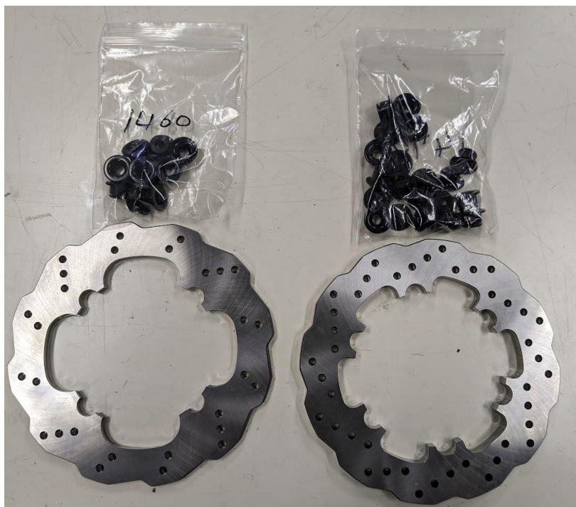
図 4. サンスター技研株式会社様より頂いた支援品

この度は、信頼性の高いブレーキディスクを支援していただき誠にありがとうございます。