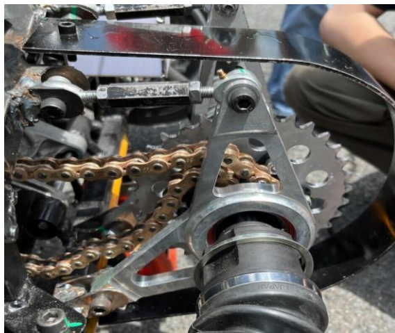
図 2. 7/10 でのトラブルとなったデフマウント

この対策として取り組んだのはチェーンの遊びを減らし、エンジン側のスプロケットとデフマウントのスプロケットの同心を取る。またデフマウントの支持剛性を上げるということを行いました。