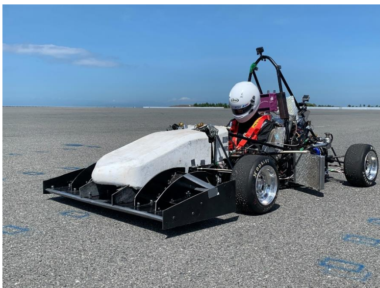
図 4. 泉大津試走会での車両