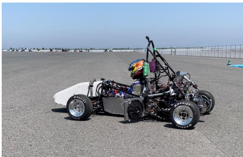
図 1. 22project の車両

初夏の候、貴社におかれましては、ますますご清栄のこととお喜び申し上げます。平素は格別のご配慮を賜り、厚く御礼申し上げます。この度は、同志社大学フォーミュラプロジェクト（以下DUF）の7月の活動についてご報告させていただきます。現在、当プロジェクトではスポンサー企業様・個人支援者様の御支援・御協力により活動を進めており、今年度の大会でより高い成績を獲得するための車両を作り上げるべく、設計製作を行っております。そして、多大なる御支援していただいております企業の皆様、先生方、OBの皆様方に深く感謝いたします。今後とも宜しくお願い申し上げます。