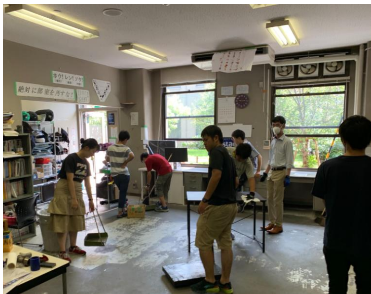
写真2. 部室の清掃の様子

大会直後の1週間ほどは、整理整頓がなっていなかった部室の清掃を部員が行いました。パソコンや冷蔵庫を含む機材等を全て外に出し、床を綺麗に箒で掃き、バルサンを焚くなどして虫対策にも力を入れました。机等のレイアウトもガラリと変更したので今まで以上に空間を有効に使えるようになりました。おかげさまで、すっきりした気持ちの良い状態で新体制の発足を迎えることが出来ました。