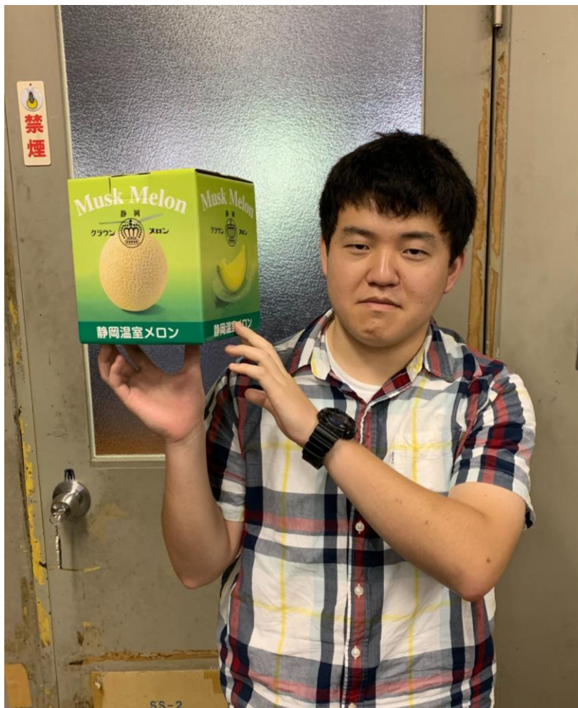
写真6 クラウンメロン

第17回大会で獲得致しました、ジャンプアップ賞の景品の一つが高級マスクメロンでした。届いてから、1週間ほど熟成させたメロンは。なんとも言えない芳醇な香りと上品な甘さで、すぐに完食致しました。