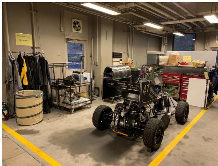
写真3. 清掃後の様子