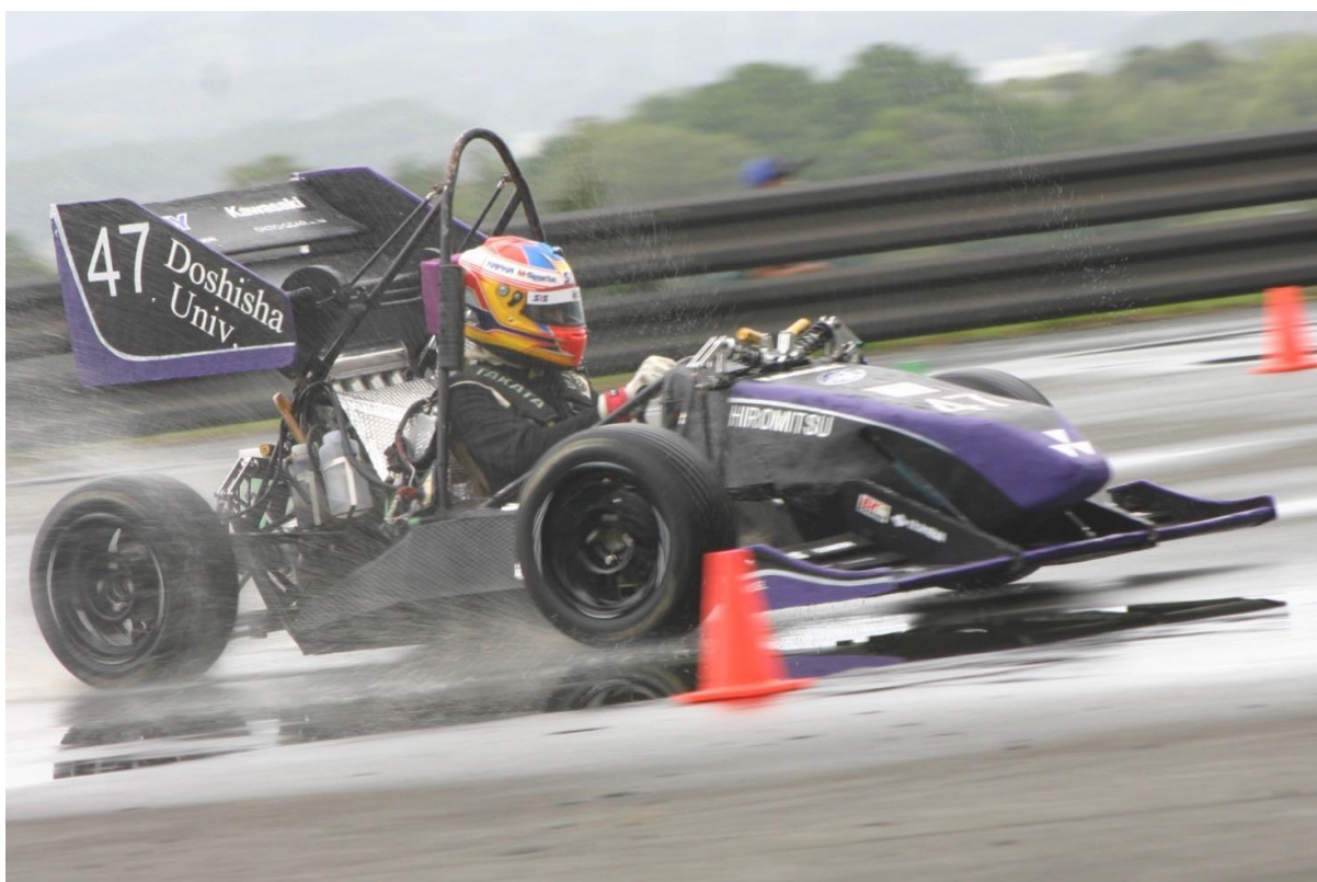
写真 1. エコパスタジアムでのエンデュランス走行時

初秋の候、ますますご繁栄の事とお喜び申し上げます。平素は格別のご配慮を賜り、厚く御礼申し上げます。この度は、同志社大学フォーミュラプロジェクト（以下 DUFPP）の 9 月の活動について報告させていただきます。現在、当プロジェクトではスポンサー企業様・個人支援者様の御支援・御協力により活動を進めており、今年度の大会でより高い成績を獲得するための車両を作り上げるべく、設計を行っております。そして、多大なるご支援していただいております企業の皆様、先生方、OB の皆様方に深く感謝いたします。今後とも宜しくお願い申し上げます。