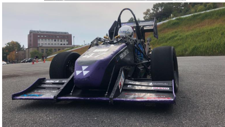
写真4,写真5 北門走行での様子