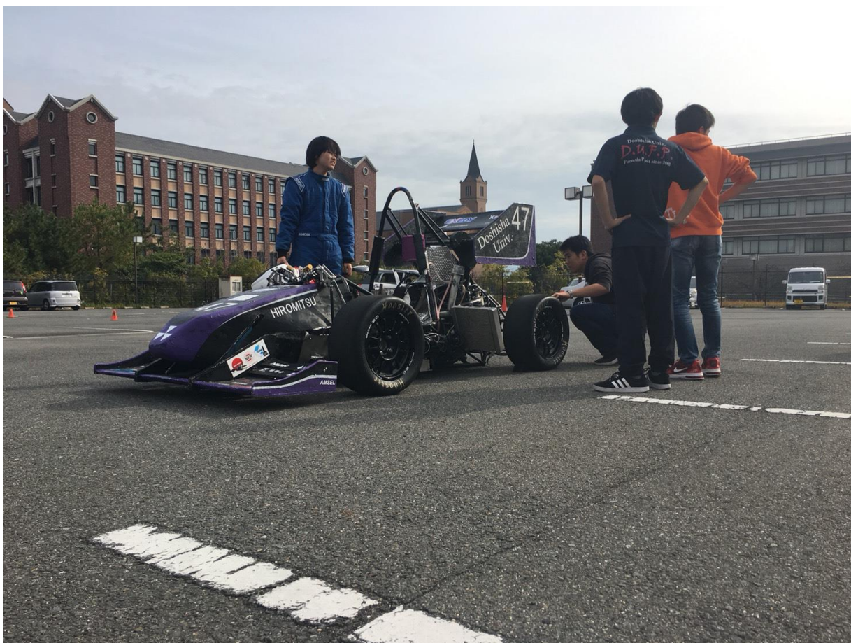
写真1.北門走行での様子

歳末の候、ますますご繁栄の事とお喜び申し上げます。平素は格別のご配慮を賜り、厚く御礼申し上げます。この度は、同志社大学フォーミュラプロジェクト（以下 DUFPP）の11月の活動についてご報告させていただきます。現在、当プロジェクトではスポンサー企業様・個人支援者様の御支援・御協力により活動を進めており、今年度の大会でより高い成績を獲得するための車両を作り上げるべく、設計を行っております。そして、多大なるご支援していただいております企業の皆様、先生方、OB の皆様方に深く感謝いたします。今後とも宜しくお願い申し上げます。