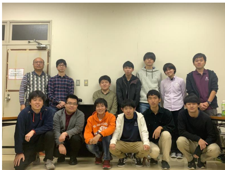
写真2,写真3 デザインレビューでの様子