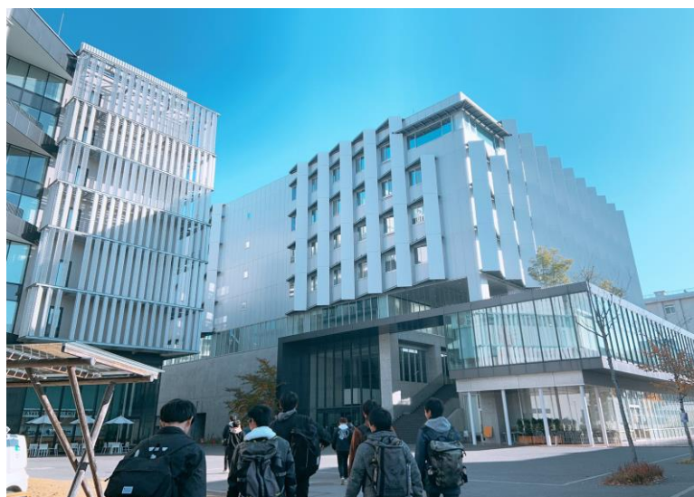
写真6 名古屋大学にて

11月30日（土）に名古屋大学で開催された静的交流会に参加致しました。デザイン、コスト、プレゼンにそれぞれ参加し、上位校の高得点獲得の秘訣などを学びました。また、他校の方と交流することが出来て、より様々な刺激を受けて帰ることが出来ました。この調子で静的審査の準備も進めていきたいと思えます。