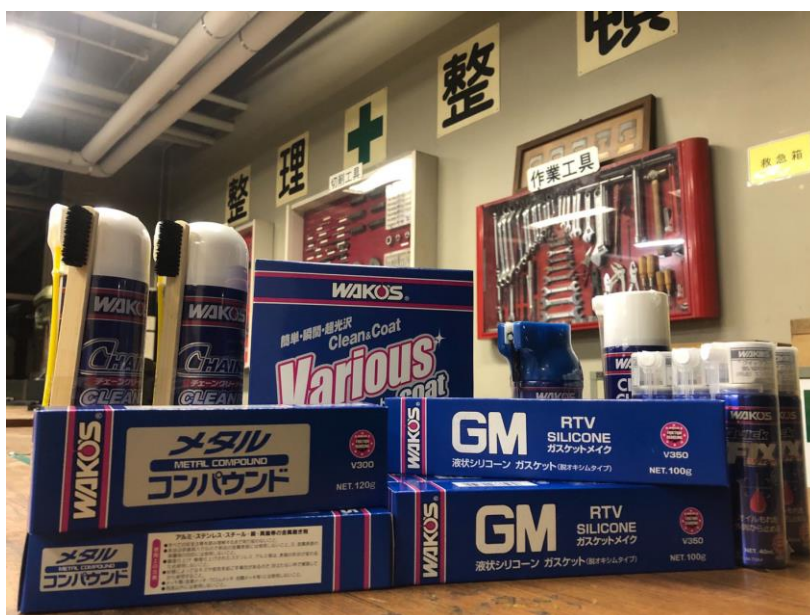
写真7 ご支援頂いた品々

株式会社和光ケミカル様より、メタルコンパウンド、チェーンクリーナー等の支援品を頂きました。ご支援、大変ありがとうございます。大切に使用させていただきます。