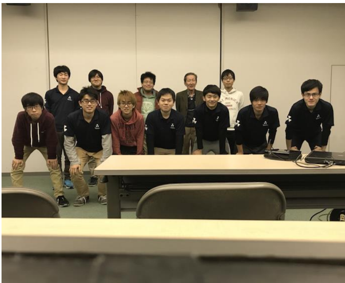
図 3. 第三回デザインレビュー

12月24日(日)に同志社大学京田辺キャンパスにて第三回デザインレビューを行いました。先生、OBの方々に出席いただいた中、今回は車両全体の設計の確認を行いました。具体的な設計に関して多くの意見をいただき、車両の設計内容を向上させるための貴重な時間となりました。いただいた意見を基に、自分たちが納得する車両の製作にむけてさらに深く考察していきます。今後とも、ご意見等宜しくお願い致します。