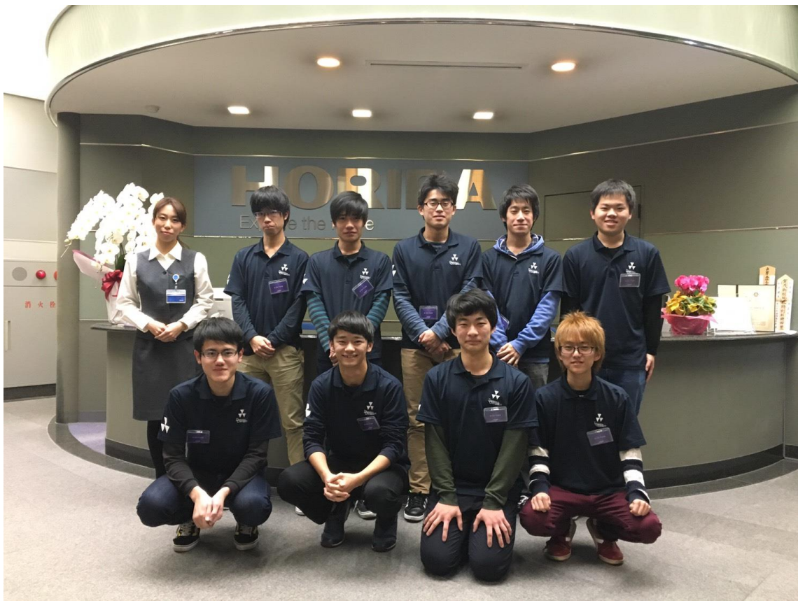
図 4. 堀場製作所様活動報告会