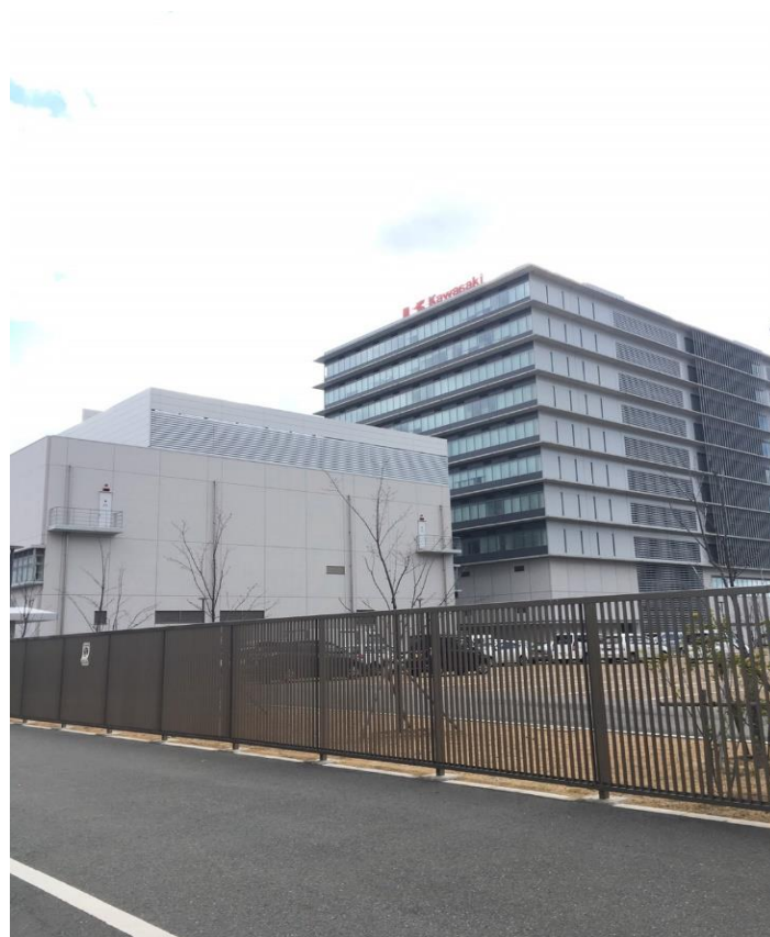
図2. 川崎重工業株式会社様 活動報告会

12月5日(火)に川崎重工株式会社様へ2017年度活動、2018年度活動方針のご報告のために伺いました。川崎重工の方や他大学チームに様々な意見、お話をいただき多くのことを吸収できました。大変貴重な場に参加させていただき、ありがとうございました。この活動報告を基に今後も活動に尽力していく所存ですので、ご支援・ご指導の程、よろしくお願い致します。