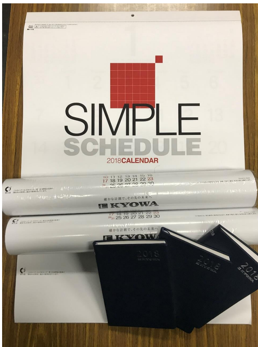
図 6. 株式会社共和電業様からいただいたカレンダー、手帳

株式会社 共和電業様から 2018 年のカレンダー、手帳をいただきました。今後のスケジュール管理に活かしていきたいと思えます。 ご支援ありがとうございました。