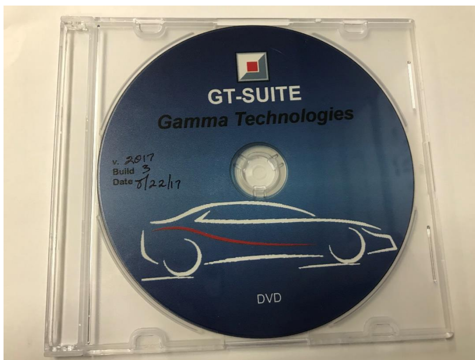
図 5. 株式会社 IDAJ 様からいただいた支援品

株式会社 IDAJ 様から自動車総合シミュレーション「GT-SUITE」を協賛価格で購入しました。今後の車両開発に使用し、車両性能の向上につなげていきます。 ご支援ありがとうございます。